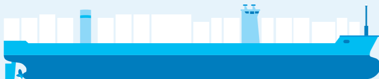
24.000 TEU CONTAINERSCHIP 16M DIEPGANG / AFMETING: 400M LENGTE x 61M BREEDTE

Om de wachttijden voor containerbinnenvaartschepen bij de Rotterdamse deepsea terminals te beperken zijn inmiddels diverse initiatieven genomen. Eén van die initiatieven is het bundelen van lading in West Brabant. De samenwerking tussen Oosterhout Container Terminal, Barge Terminal Tilburg, Combined Cargo Terminals en Moerdijk Container Terminals en de deepsea terminals in de Rotterdamse haven op de 'West-Brabant Corridor' is het eerste concrete initiatief waar positieve resultaten benoemd kunnen worden. Door het bundelen van lading op deze corridor is een betere bezettingsgraad van de binnenvaartschepen gerealiseerd en daarmee zijn de wachttijden bij de terminals verlaagd.